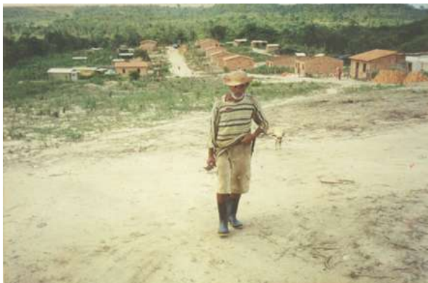
Agrovilas em construção no Assentamento Terra Vista, data aproximada 1996.