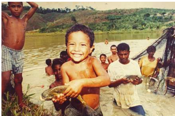
Represa para criação de peixes no Assentamento Terra Vista, entre 1996 e 1999.