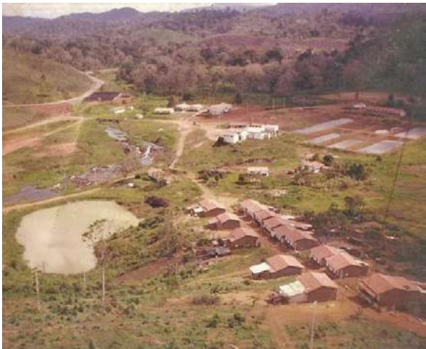
Vista aérea de parte do Assentamento Terra Vista, data aproximada 1997.