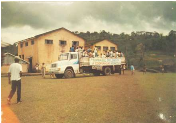
Coprasul – Cooperativa de Trabalhadores do Assentamento Terra Vista, entre 1995 e 2000.