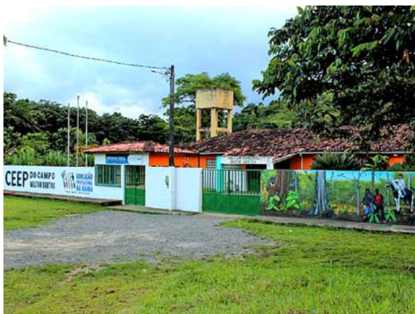
Centro Estadual de Educação Profissional e Técnica da Floresta, do Cacau e do Chocolate Milton Santos, primeira escola do campo em nível médio da Bahia, conquistada em 2010, sem data.